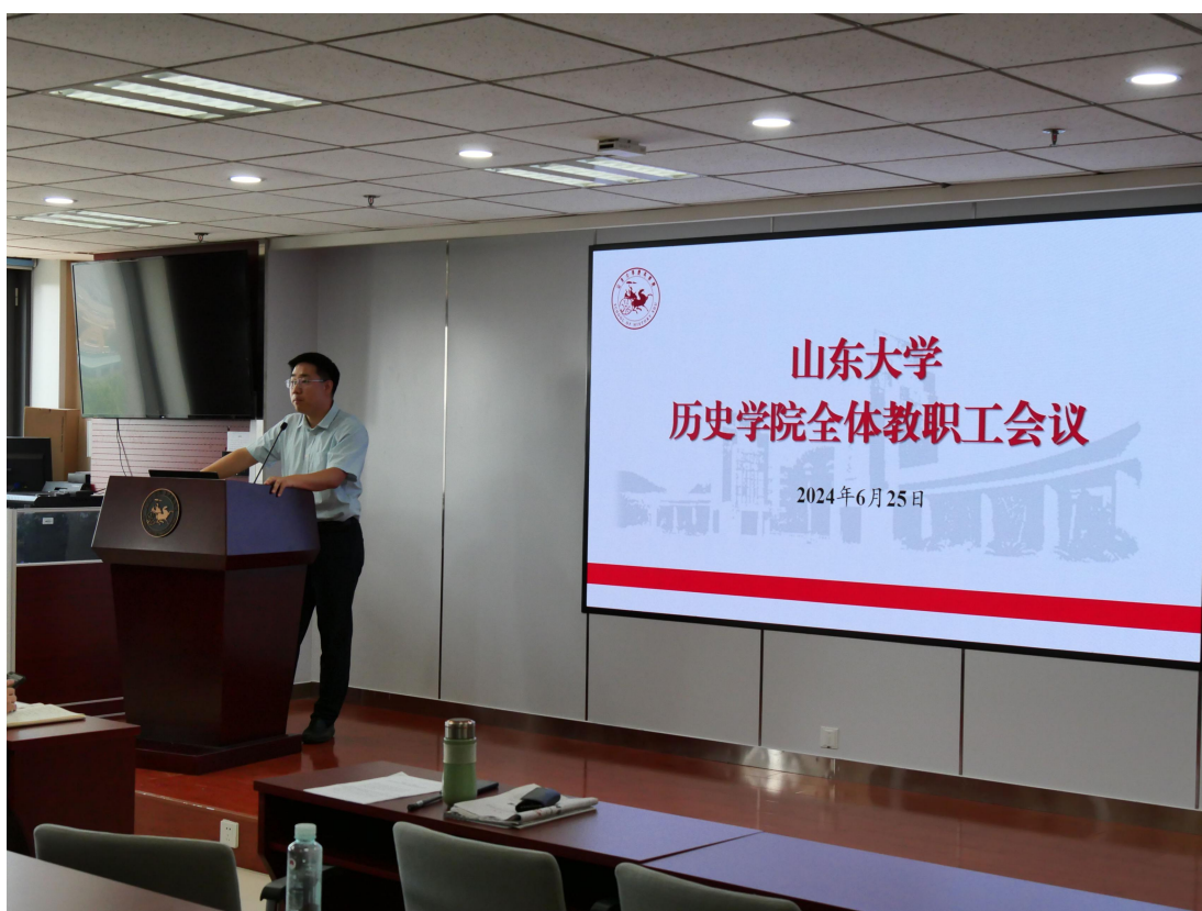
历史学院全体教职工参加会议。